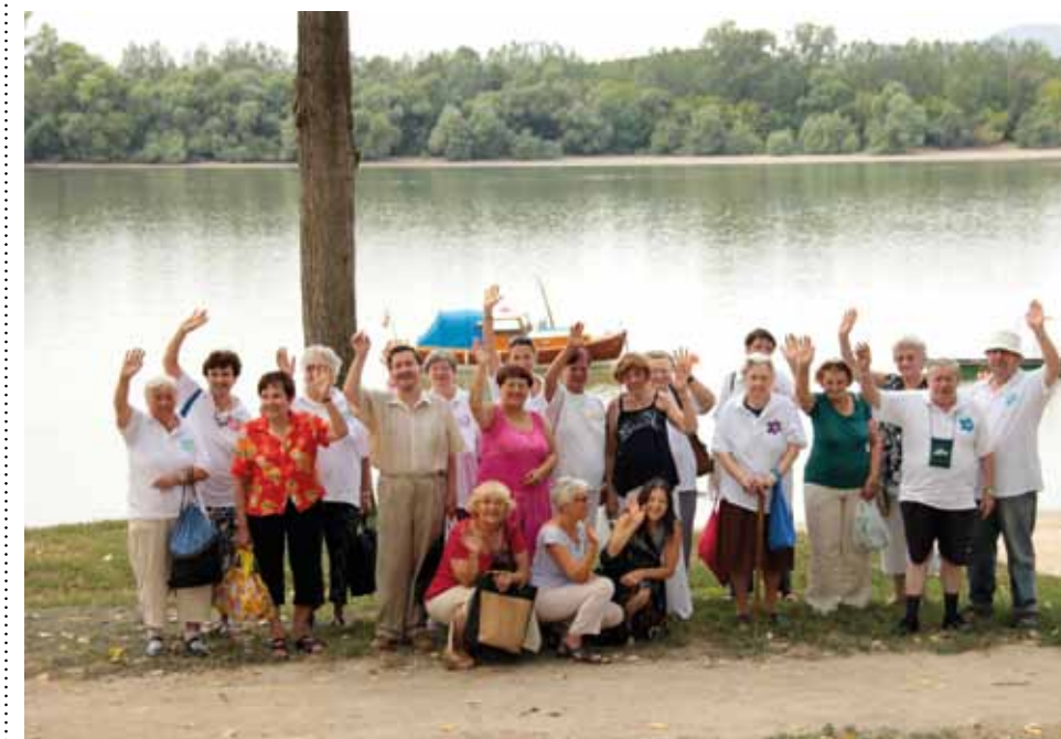
A kerületi idősek látogatása a rendőrkutya-kiképző központban

Bátran mondhatom: nálunk mindenki megtalálja a személyére szabott gondoskodást.