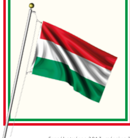
Erzsébetváros 2013. március 7.

Tisztelettel kérjük az erzsébetvárosi társasházak közös képviselőit, és azokat, akiknek módjában áll, hogy a március 15-i nemzeti ünnepünk alkalmából a nemzeti lobogót helyezték ki az épületekre!