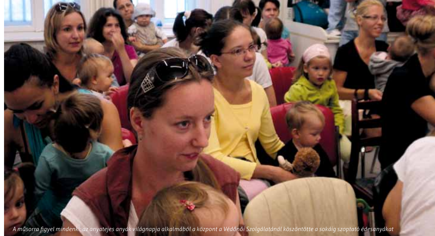
A műsorra figyel mindenki: az anyatejes anyák világnapja alkalmából a központ a Védőnői Szolgálatánál köszöntötte a sokáig szoptató édesanyákat

ő maga nem tudja pontosan, milyen lehetőségei vannak. „Házon belül” tudjuk Erzsébetváros polgárait a nekik legmegfelelőbb szolgáltatáshoz juttatni, akár egy telefonszámot követően is a legjobb helyre irányíthatjuk őket.