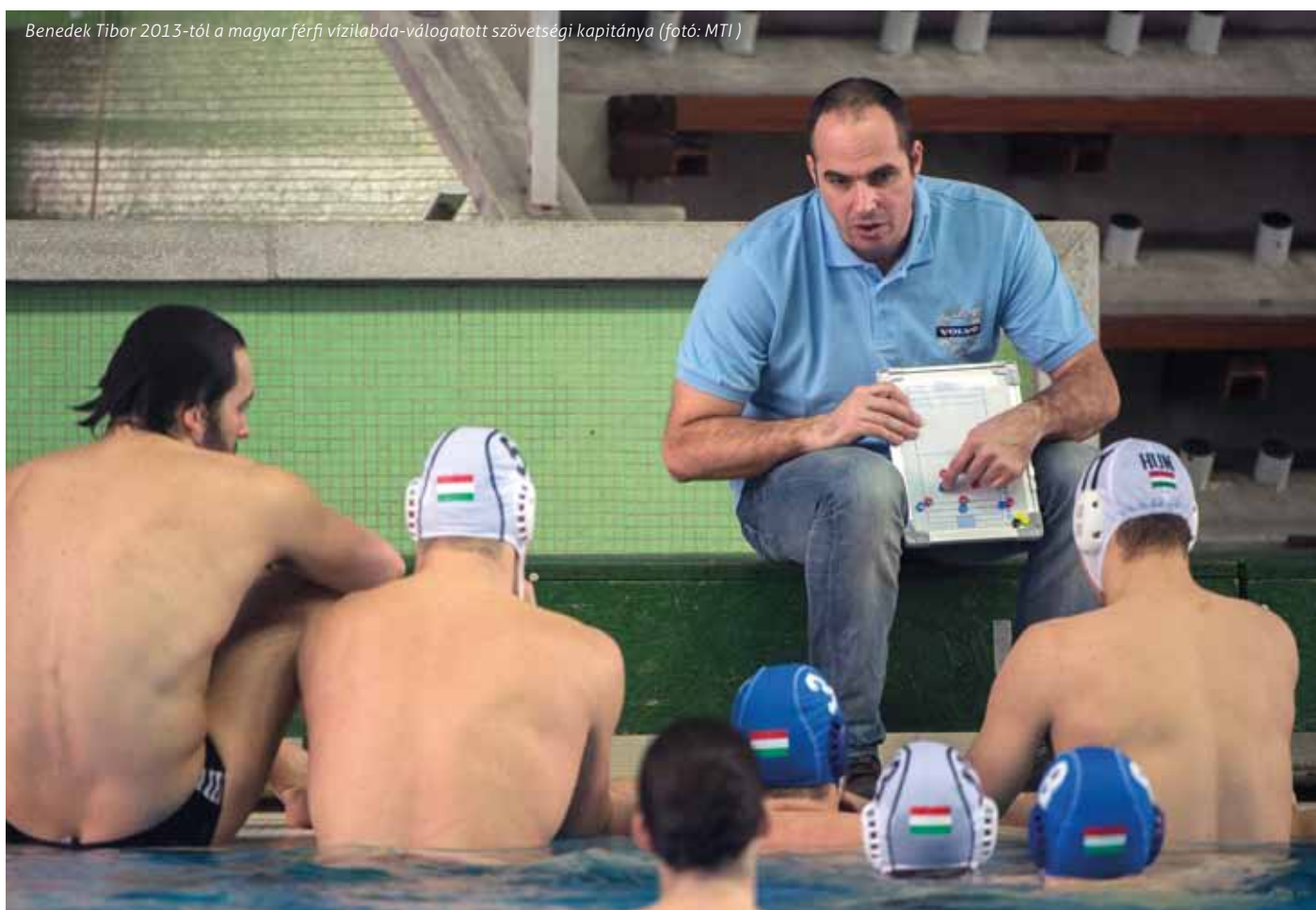
Benedek Tibor 2013-tól a magyar férfi vízilabda-válogatott szövetségi kapitánya

A londoni olimpia után megállapíthattuk, hogy Pekinget követően egy látványos visszaesés következett, hiszen az elmúlt négy évben egy EB bronzon kívül nem tudtunk jobb eredményt elérni, és ez kétségtelenül meghatározza a jelenlegi helyzetünket is. A következő évek feladata, hogy újra stabilan a legjobb négy közé kerüljünk, ismét döntőket tudjunk játszani, és akár világversenyekeket is nyerjünk. Nagy