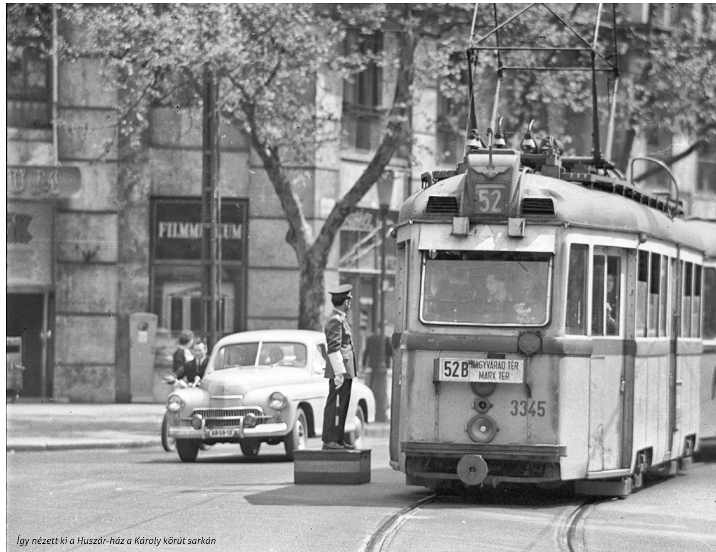
Igy nézett ki a Huszár-ház a Károly körút sarkán