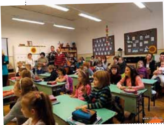
www.erzsebetvaros.hu • www.erzsebetvarosimedia.hu

Február hónapban nyílt napokon mutatkozott be az Erzsébetvárosi Kéttannyelvű Általános Iskola, Szakiskola és Szakközépiskola minden leendő első osztályosnak és szüleinek. A Kertész utcai iskolában február 26-án, kedden 9.00–11.30-ig tekinthettek be az érdeklődők az iskolában folyó nevelő-oktató munkába, majd óralátogató-sokon keresztül testnevelés, néptánc és informatika-foglalkozásokon vehettek részt a vendégek. A Dob utcai iskolában február 20-án és 27-én ismerkedhettek meg a szeptemberben induló két tanítási nyelvű osztályok tanító nénijeivel, és részesei lehetnek a „már” iskolások mindennapi tevékenységeinek. A nyílt napok 9 órától kezdődtek. Az érdeklődők részletes tájékoztatót kaptak az iskoláról, 10 órától órarászleteken vehettek részt, ahol bepillanthattak az angol, a magyar és az interaktív táblás oktatásba az 1. és a 4. évfolyamokon. A program végén kötetlen beszélgetés során kaptak választ a szülők az őket és a gyerekeiket érdeklő kérdésekről. A február 6-án, 12-én és 13-án megtartott nyílt napokon nagyon nagy számban jelentek meg érdeklődők, bizonyítva, milyen nagy szükség van a közvetlen és nyílt kapcsolattartásra a szülők és az iskola között.