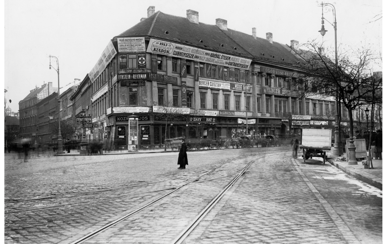
A Huszár-ház helyén álló épület valamikor a hatvanas években, amikor még a földszinten a Film-múzeum működött.

„Ám bontsák le a Huszár-házat... a régi Pestnek egy ábrándos tisztelője elmondja majd azt a sok anekdotát, ami e vén falakhoz fűződik.”